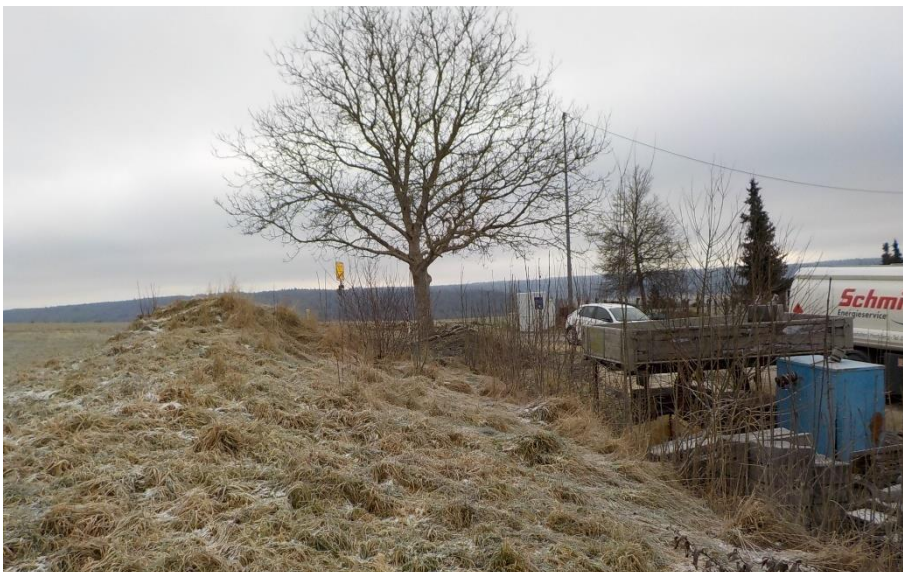
Abb. 3: Mögliches Eidechsenhabitat

Der Geltungsbereich und die nördlich und westlich angrenzenden Flächen werden als Grünland genutzt. Nördlich des Geltungsbereichs besteht ein Fahrsilo. Im Süden des Geltungsbereichs besteht im Übergang zum bestehenden Gewerbegebiet ein vollständig mit einer grasreichen Ruderalvegetation überwachsener Erdhaufen. In den Randbereichen des bestehenden Gewerbegebiets wurden Steine, Kies und sonstige Materialien abgelagert (s. Abb. 3). In diesen Bereichen kommt Gehölzsukzession auf. Zudem besteht ein einzelner Baum. Westlich des Gewerbebetriebs besteht eine gem. § 33 NatSchG geschützte Feldhecke (Biotopnummer 177224156516). Südöstlich des Geltungsbereichs verläuft die K6743. Entlang des straßenbegleitenden Trockengrabens hat sich eine grasreiche Ruderalvegetation entwickelt. Südlich der Straße besteht Ackernutzung.