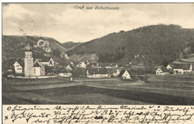
Die Teilnehmenden üben unter anderem das Lesen von Postkarten, wie etwa hier eine Ansichtskarte von Bichishausen.

Das Kreisarchiv ist das Gedächtnis und die Kulturinstitution des Landkreises und steht allen Bürgerinnen und Bürgern offen. Als moderner Informationsdienstleister arbeitet es mit wissenschaftlichen Institutionen, Heimat- und Familienforschenden sowie Geschichtsvereinen zusammen. Mehr Infos zu den Veranstaltungen des Kreisarchivs gibt es auf der Homepage www.kultur-machen.de oder im Newsletter www.kultur-machen.de/newsletter