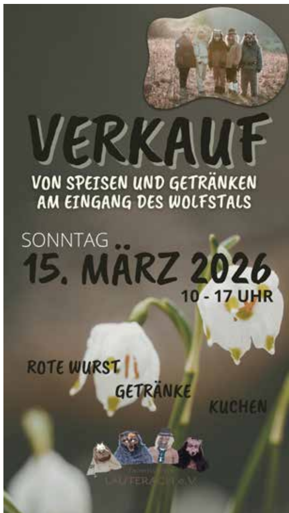
Verkauf zur Märzenbecherblüte

Der Verkauf zur Märzenbecherblüte findet am Eingang des Wolfstals bei Lauterach statt.