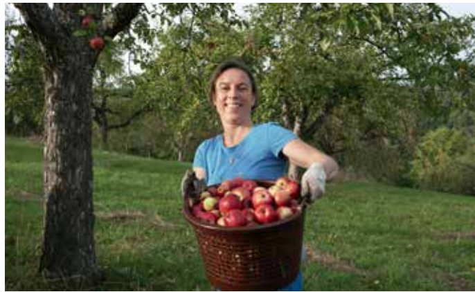
Foto: Geschmackliche Vielfalt: Tafeläpfel von der Streuobstwiese. Quelle: © Streuobstparadies