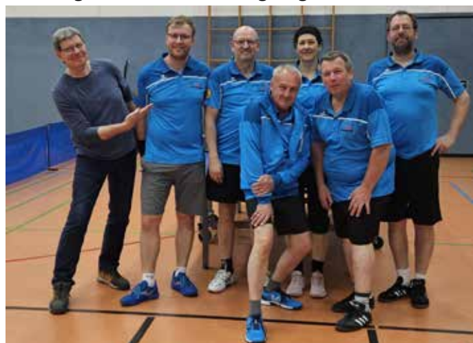
SG TSV Kleinengstingen/TSG Zwiefalten II