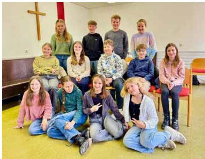
Blaulichtgottesdienst am 30.01.2026 im Münster Zwiefalten