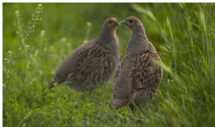
Das Rebhuhn ist der Vogel des Jahres 2026

Das Rebhuhn wird im UNESCO-ausgezeichneten Biosphärengebiet Schwäbischen Alb seit längerer Zeit kaum noch gesichtet. Es ist daher eher unwahrscheinlich dem scheuen Vogel im Rahmen dieses Monitorings auch tatsächlich zu begegnen. Daher soll die Sensibilisierung für seine Lebensraumansprüche im Mittelpunkt der Aktion stehen. Diese beinhalten strukturreiche Agrarlandschaften mit Brachen, Säumen, Hecken, ausreichend Deckung sowie ein vielfältiges Nahrungsangebot. Neben dem Rebhuhn sind auch andere Feldvogelarten wie Feldlerche oder Wachtel auf diese Form der Kulturlandschaft angewiesen und können im Rahmen des Monitorings mit größerer Wahrscheinlichkeit beobachtet werden.