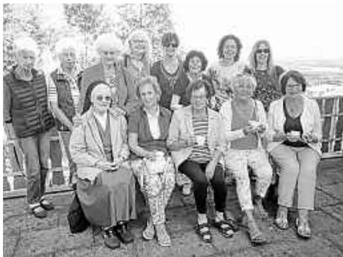
Zwiefalter Frauen bei der diesjährigen Busenwallfahrt am 10. Juli