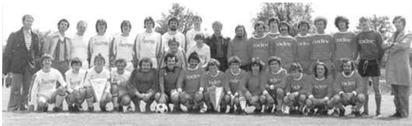
1979 TSG Zwiefalten in La Tessoualle zur Einweihung des neuen Sportplatzes

45 Jahre Partnerschaft zwischen unseren beiden Gemeinden, sind 45 Jahre gefüllt mit intensiven Begegnungen aller Art. Begegnungen und gemeinsame Erlebnisse auch zwischen unseren Vereinen in Zwiefalten und La Tessoualle. Gemeinsam wurden musikalische Konzerte bestritten oder sich beim Fußball gemessen. In grandioser Erinnerung ist uns der Einzug mit dem Fanfarenzug in La Tessoualle anlässlich des 40-jährigen Jubiläums vor 5 Jahren. Der Fanfarenzug unserer Kolpingsfamilie, die Abteilung Fußball der TSG, die Musikkapelle, das Orchestre Harmonique aus La Tessoualle, sowie die Sängerinnen und Sänger des Weinrauchchors - Sport und Musik, gemeinsame Interessen und Aktivitäten verbinden und sind schon immer ein Teil unserer deutsch-französischen Partnerschaft gewesen und werden es auch weiterhin sein.