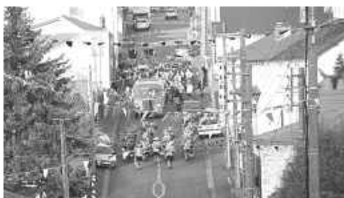
Fanfarenzug der Kolpingfamilie beim Einzug in La Tessoualle anlässlich des 40-jährigen Jubiläums 2013

Die Gemeinde und der Partnerschaftsverein bedanken sich bei allen Familien, die unseren französischen Freunden ein Quartier zur Verfügung gestellt haben. Unglaublich, wir haben für alle 195 Gäste ein Quartier gefunden!!