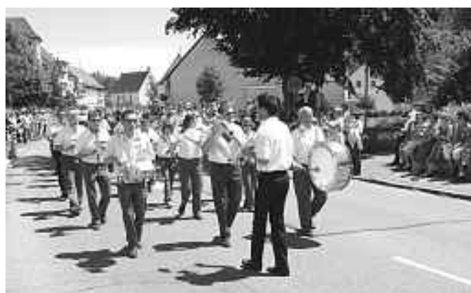
Orchestre Harmonique 2007 Umzug Kreismusikfest, 100 Jahre Musikkapelle Zwiefalten

Verantwortlich: Bürgermeister oder sein Vertreter im Amt