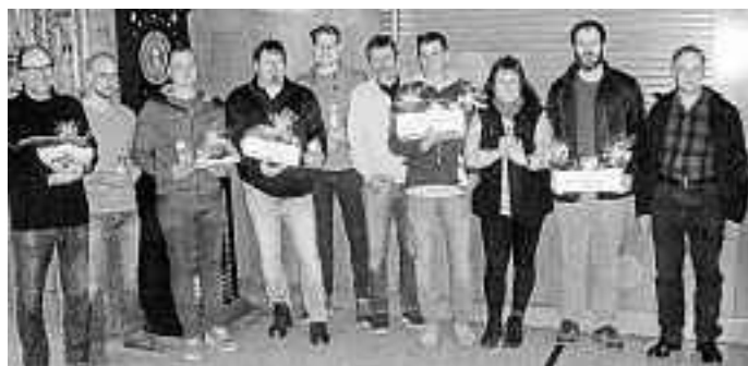
Sieger des Osterschießens 2018

Die vollständigen Ergebnislisten finden sich auf www.schuetzenverein-zwiefalten.de