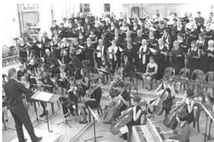
Weinrauchchor mit Orchester