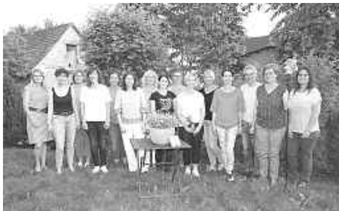
Vorstandschafft und Beisitzer des Fördervereins Münsterschule Zwiefalten e.V.