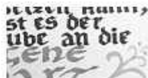
Vero Bobke Kalligrafie & Skulptur