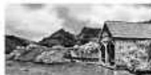
Elvira Gresham Malerei / Öl