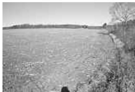
kann die Erosion auf großen Feldern und - je nach Kultur - lange Zeit blankem Boden zu erheblichen Abschwämmungen führen