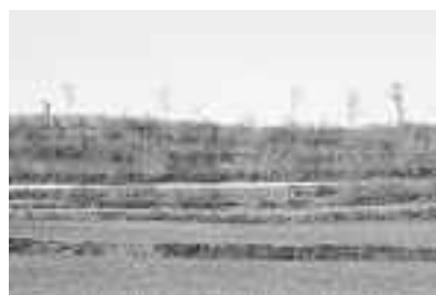
Während früher die Flurstücke in Hanglagen schmal und jeweils mit einem Rain und Heckenbewuchs das Wasser aufnahmen...