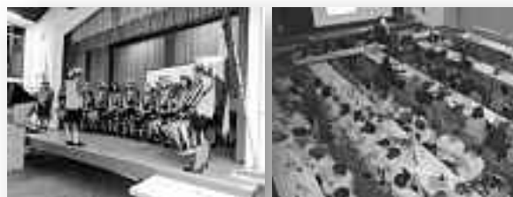
Eröffnung durch Kolping-Fanfarenzug Begrüßung und Gedenken