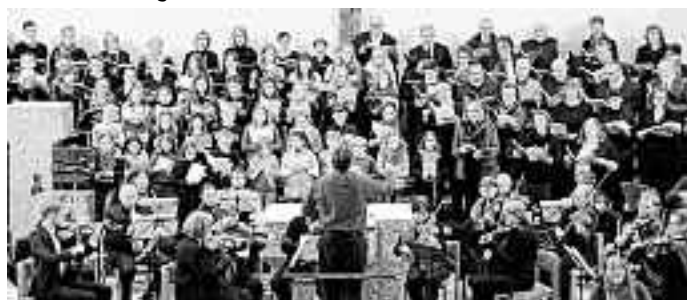
Chöre und Orchester der Martinskirche Münsingen

Das Konzert erklingt bereits am Samstag, 13. April, um 19 Uhr in der Martinskirche Münsingen. Nummerierte Eintrittskarten für die Münsinger Aufführung zu 12 € und 10 € gibt es im Vorverkauf bei der Buchhandlung one.Münsingen, Uracher Str. 1. Ermäßigte Karten kosten 10 und 8 €, Schüler sind frei. Telefonisch bestellte Karten werden portofrei zugeschickt. Karten können auch unter kantorat.muensingen@gmx.de reserviert werden. Restkarten (zzgl. 2 €) gibt es an der Abendkasse, die ab 18.30 Uhr geöffnet ist.