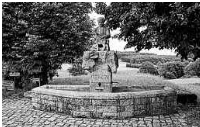
Wendelinusbrunnen in Gauingen aus Gauinger Travertin, Quelle: F. Schmid