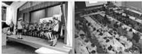
Eröffnung durch Kolping-Fanfarenzug Begrüßung und Gedenken