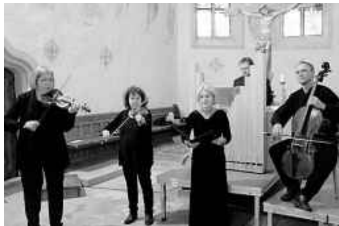
Barockensemble in der Stephanuskirche Guorn (2016)

Der Eintritt zu beiden Konzerten ist frei, es wird um Spenden gebeten.