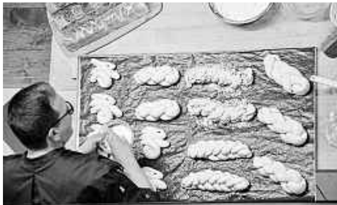
Backvorführung bei Fa. Häussler

Einige Teilnehmerinnen waren bereits schon einmal bei Fa. Häussler zu Gast und einige noch nie. Dennoch war für jeden etwas Neues, leckere Ideen und Interessantes dabei, das sicherlich den Lieben zu Hause einmal zu Gute kommen wird. Die lockere und sehr amüsante Art des Bäckermeisters machte den Nachmittag sehr unterhaltsam und kurzweilig. Besonders haben wir uns über den Besuch vieler Nichtmitglieder gefreut – ein schöner Mittag mit Jung und Alt mit vielen Frauen und einem Mann!