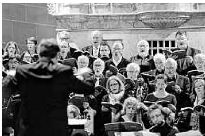
Kantorei der Martinskirche Münsingen bei der Aufführung der H-Moll-Messe im Mai 2017

Die Abendmusik wird am Sonntag, 25. März, um 19 Uhr in der Blasiuskirche Kleinengstingen wiederholt. Der Eintritt zu beiden Veranstaltungen ist frei.