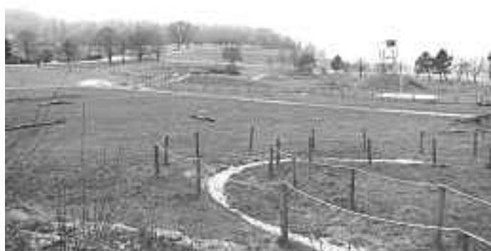
Bike-Park Münsingen, Foto: LEADER Mittlere Alb

Die LEADER-Aktionsgruppe Mittlere Alb wählt fortlaufend innovative Projekte aus, die mit EU-Fördergeldern unterstützt werden und die die Weiterentwicklung unserer Region voran-