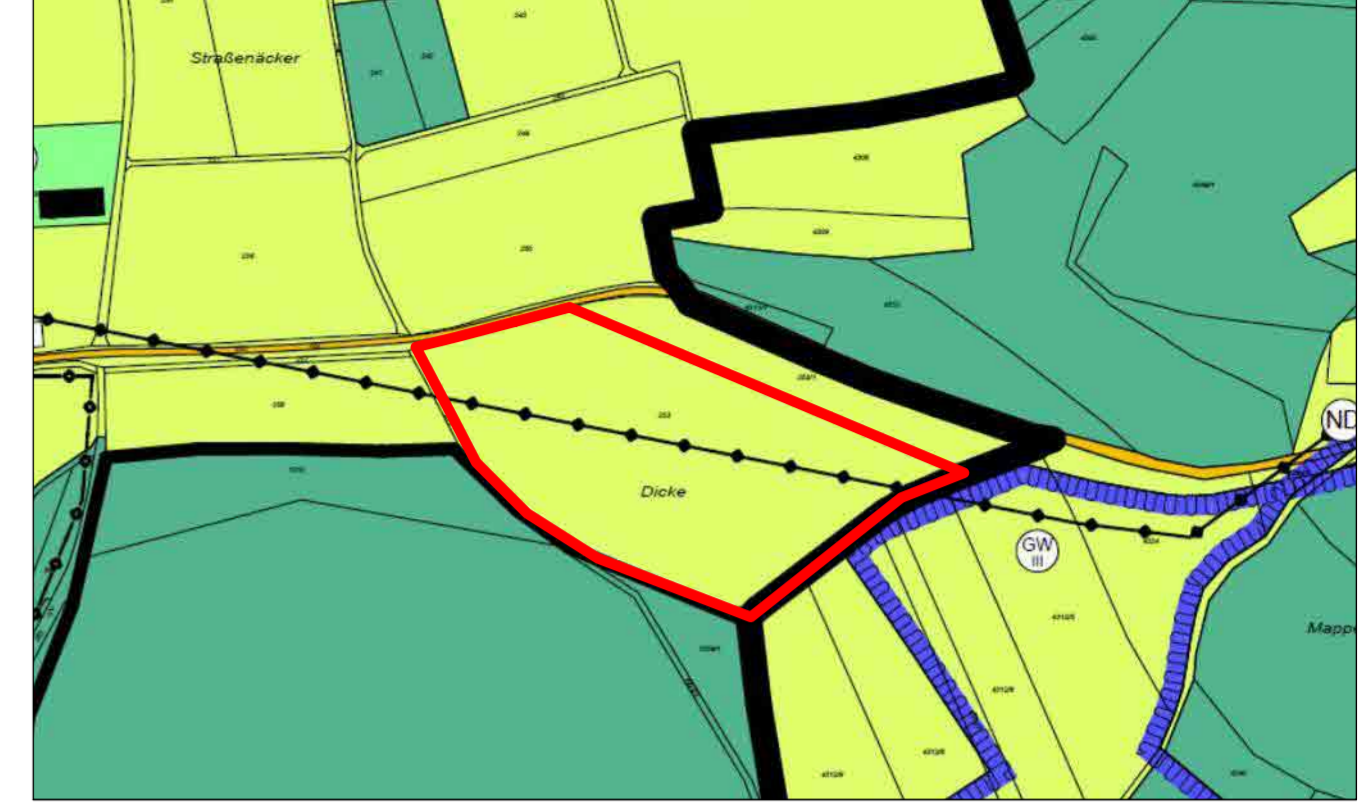
Auszug FNP GVV Zwiefalten-Hayingen