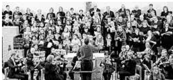
Chöre und Orchester der Martinskirche Münsingen