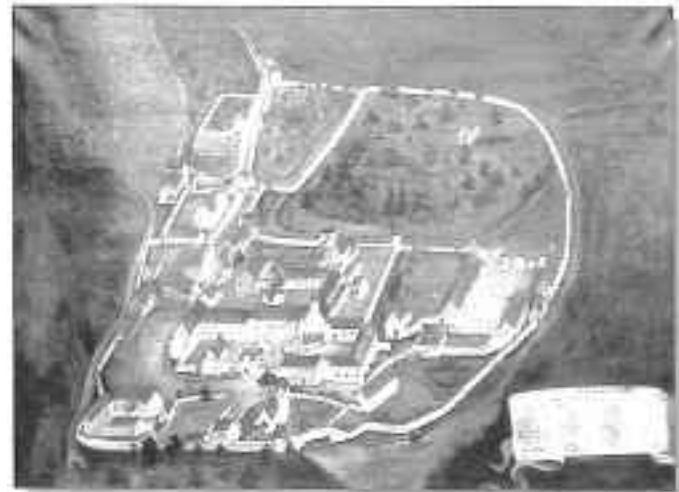
Klosterprospekt aus dem Jahr 1858. Das Original ist in Privatbesitz.