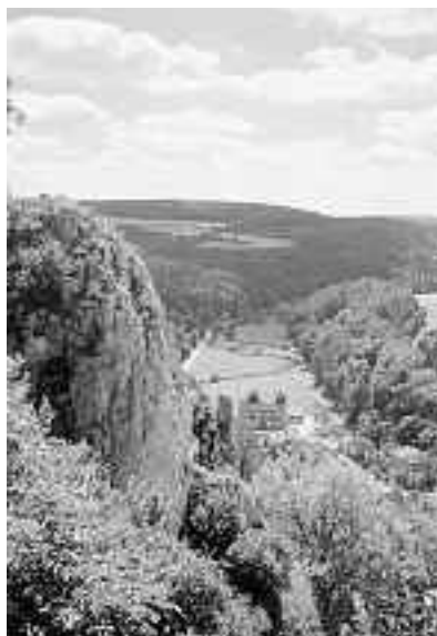
Ein touristischer Leuchtturm der Region: Das Große Lautertal