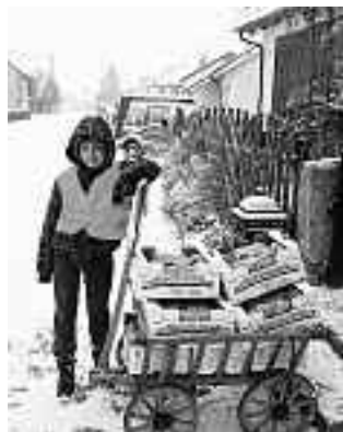
Voll beladener Leiterwagen