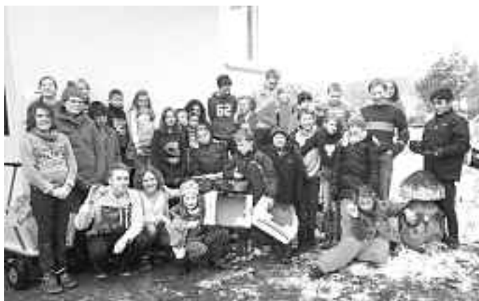
Alle Helfer der Aktion

Die „Kenia-Hilfe Schwäbische Alb“ verbessert die Lebensbedingungen von Straßenkindern und Jugendlichen in Karai bei Nairobi indem sie für 160 Jungen und Mädchen ab 4 Jahren ein Heim, Schulbildung sowie Nahrung und Schutz bieten. Sie können sich gerne unter www.keniahilfe-schwaebische-alb.de informieren.