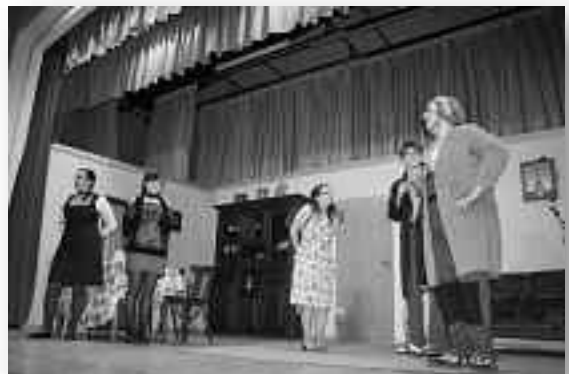
Schwäbische Komödie in 3 Akten von Bernd Gombold