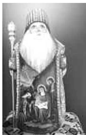
Russland: Handgeschnitztes „Väterchen Frost“ mit handgemaltem orientalisches/ westlichen Krippenmotiv